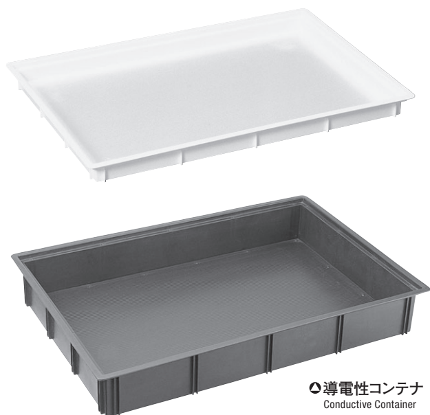
○導電性コンテナ Conductive Container

Inner sheets for Star Seiki standard Pallet Changer are also available.